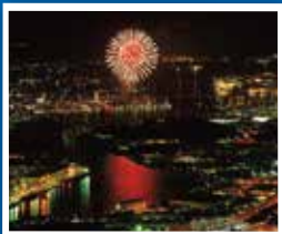
구키노우미 만과 '구키노우미 불꽃놀이'

토·일·국경일에 JR 아하타 역⇔사라쿠라야마 케이블카 산록 역 구간을 운행하고 있습니다.