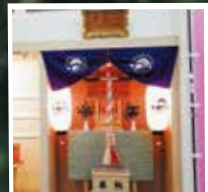
산상 역에 있는 케이블카 신사와 사람 운세뽑기