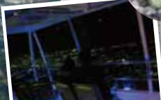
360도를 조망할 수 있는 슬로프카 내부