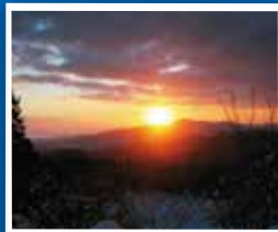
신년 일출 때는 케이블카도 새벽 운행

기타큐슈를 대표하는 산, 사라쿠라야마 산(표고 622m)에서 바라보는 파노라마처럼 펼쳐지는 경치(시야 각도 200도)는 모두가 감동할 만한 압도적인 스케일을 자랑합니다. 현해탄, 히비키나다·스오나다 해역에 접하며 동서북쪽으로 넓게 펼쳐져 있어, 구키노우미 만, 간몬 해협, 기타큐슈 공항 등 산과 바다 그리고 도시가 어우러진 인구 100만명의 도시 기타큐슈시 내외의 전경을 바라볼 수 있습니다. 본격적인 등산 코스 수준인 표고이지만 케이블카·슬로프카를 갈아타면 약 10분만에 가볍게 산정상까지 갈 수 있는 것도 인기의 비결. 또한 2015년 4월 1일에 '사라쿠라야마 산정상'과 '사라쿠라야마 야경'이 '연인의 성지'로 선정되었습니다. 꼭 한번 이 최상의 경치를 즐겨 주십시오.