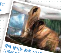
박력 넘치는 황후 삼나무의 그루터기를 전시