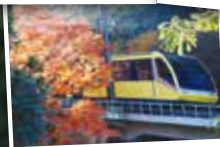
선로변에는 계절마다 꽃과 나무가 가득합니다