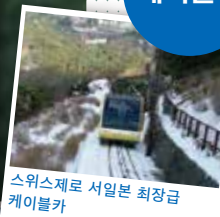
스위스로 서일본 최장급 케이블카