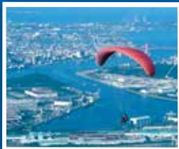
사라쿠라야마 산은 패러글라이딩의 성지입니다.