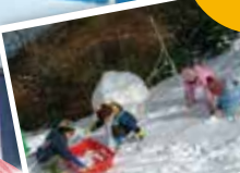
겨울은 눈놀이를 즐기는 어린이들로 붐빕니다.

시가지를 한눈에 바라볼 수 있는 파노라마 전망대입니다. 전망실에서 바라보는 웅대한 경치는 계절감이 넘쳐흐려 매력적입니다. 야간에는 데크에 깔려 있는 축광석이 환상적인 공간을 연출합니다. 슬로프카의 전망대 역과 인접하고 있으며 휴식·레스토랑·라이브 이벤트·대피소 등 다양한 기능을 가진 시설입니다.